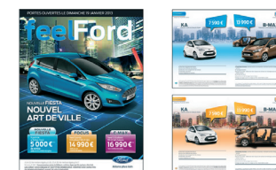
Annonce presse / Affiche